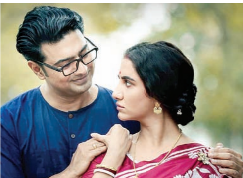
ব্যাকশ্যে: দেবের সঙ্গে।

কথাই মনে পড়ছে। তবে, এখানে একটা চরিত্র মানুষ, অন্যটা রোবট। ... 'বুমেরাং' ছবিতে জিৎ-এর স্ত্রী। আর, নিশা রোবট। তাই তো? ... হ্যাঁ, একদম তাই। ... কোন্ চরিত্রটা আপনার ফেভারিট? কোন্ চরিত্রে অভিনয় করতে বেশি ভাল লাগে? ... দুটো চরিত্রই ফেভারিট, এটাও বোধহয় বলা উচিত।