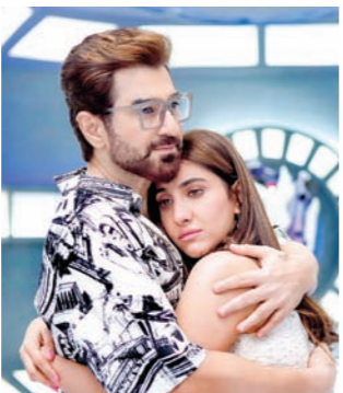
বুমেরাং: জিতের সঙ্গে।

একই দিনে রিলিজ করছে প্রসেনজিৎ-স্বত্বপূর্ণার ৫০তম ছবি 'অযোগ্য' এবং জিৎ-রুক্মিণী জুটির ছবি 'বুমেরাং'। এটা কি রুক্মিণীর কাছে চাপের? ... একটুও চাপের নয়! প্রথমেই দর্শকরা জানছেন, প্রসেনজিৎ-স্বত্বপূর্ণার ৫০তম ছবির দিনেই জিৎ-রুক্মিণী জুটির প্রথম ছবি রিলিজ করছে।